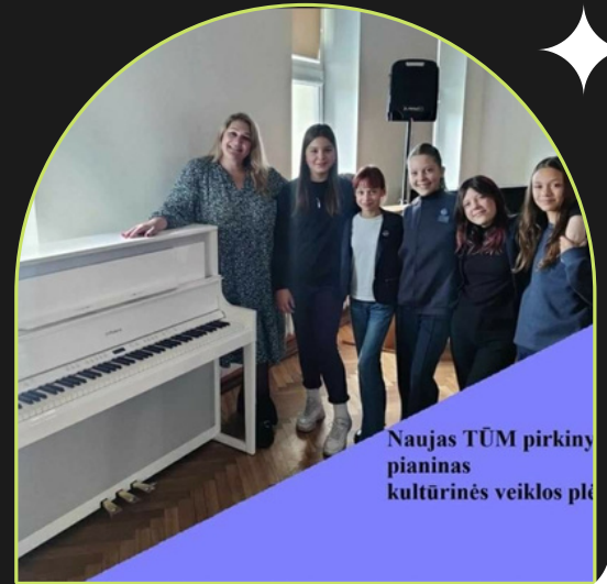
Naujas TŪM pirkinys pianinas kultūrinės veiklos plė

Įsigytos spintelės 5–8 klasių mokiniams asmeninių daiktų laikymui.