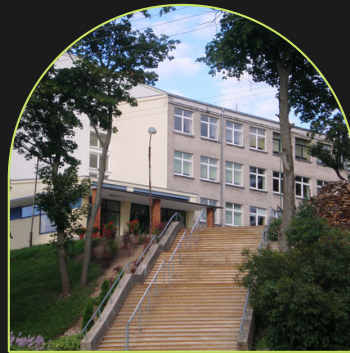
Juozo Paukštelio progimnazija